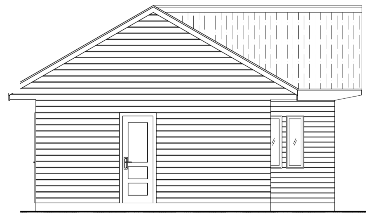
ELEVACIÓN LATERAL IZQUIERDA