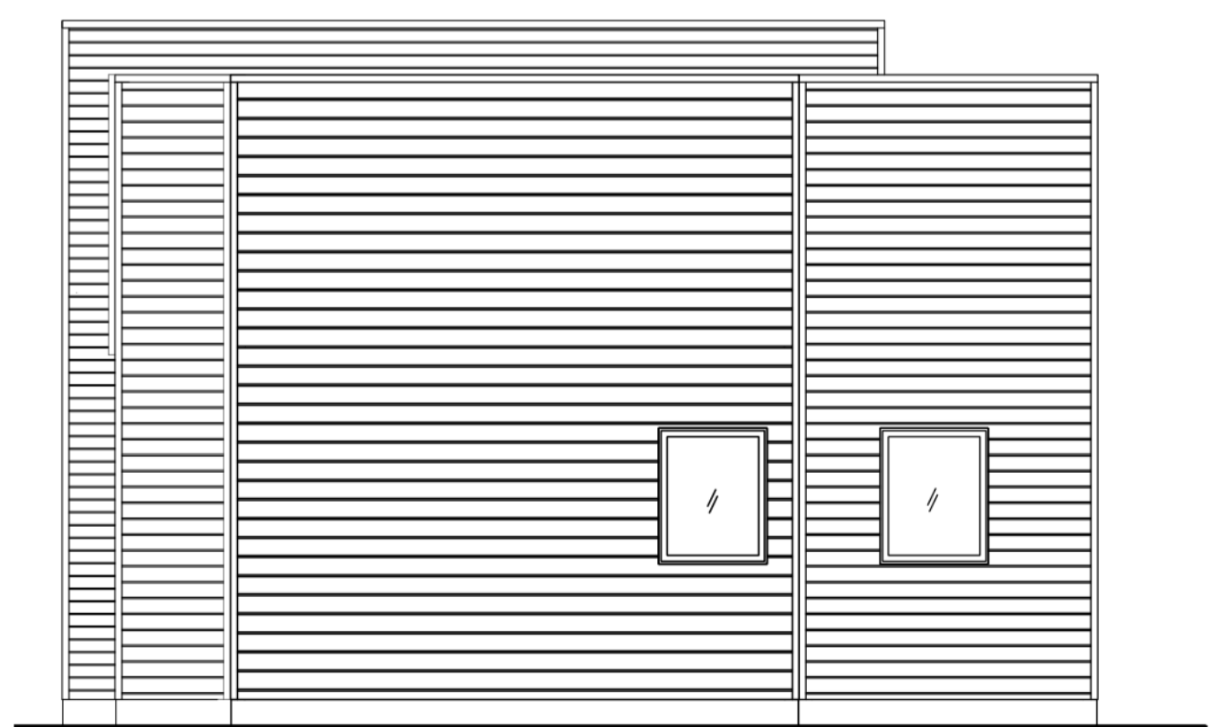
ELEVACIÓN LATERAL DERECHA